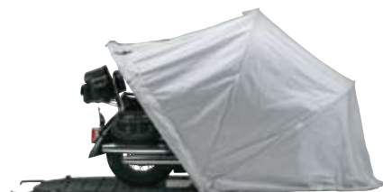
3 もし、ひっかかるようでしたらファスナーを開いてください。