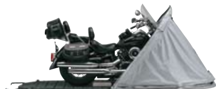
2 後は簡単。カバーを引っ張って、バイクにかけます。