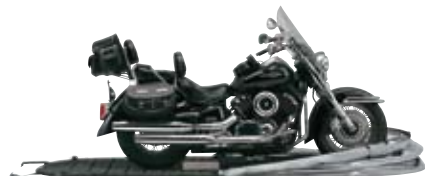
1 バイクを入れたら、スタンドをかけて固定します。