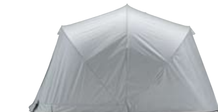
4 カバーをロックしてマジックテープを留めれば、完成。