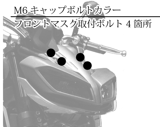
M6 キャップボルトカラー フロントマスク取付ボルト 4箇所