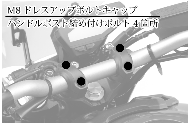
M8 ドレスアップボルトキャップ ハンドルポスト締め付けボルト 4箇所