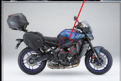
※画像はMT-09への装着イメージです。