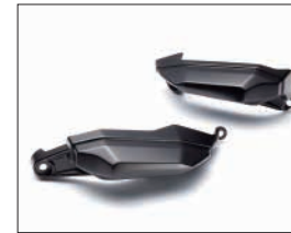
サイドスライダー

Q5K-YSK-112-T01 希望小売価格 ¥8,800 (本体価格 ¥8,000) (D5) XSR700にマッチしたデザイン専用設計のタンクサイドパッド。装着することでタンクへの傷を防止するだけでなく、ニグリップ感が向上します。材質:NBR(ニトリルゴム)。左右セット。(取付0.2h)