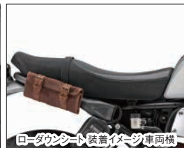
ローダウンシート装着イメージ 車両横

Q5K-YSK-112-G03 希望小売価格 ¥46,200 (本体価格 ¥42,000) (D5) XSR700用の純正シートをベースに座面のウレタンを低反発性ウレタンへ変更。見た目は純正と変わりませんが、着座時の沈み込み量を純正比で約20mmダウンし、足つき性を向上します。(取付0.1h) ※使用者の体重により沈み込み量は変化します。