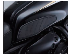
タンクサイドパッド

Q5K-YSK-112-S01 希望小売価格 ¥27,500 (本体価格 ¥25,000) (D5) 高品質なアルミニウム製のサイドカバーで車両のオリジナル感を出します。左右セット。(取付0.2h) ※在庫無くなり次第販売を終了致します。