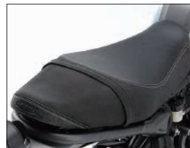
ローダウンシート

Q5K-YSK-112-G03 希望小売価格 ¥46,200 (本体価格 ¥42,000) (D5) XSR700用の純正シートをベースに座面のウレタンを低反発性ウレタンへ変更。見た目は純正と変わりませんが、着座時の沈み込み量を純正比で約20mmダウンし、足つき性を向上します。(取付0.1h) ※使用者の体重により沈み込み量は変化します。