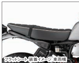
フラットシート装着イメージ 車両横

Q5K-YSK-112-G02 希望小売価格 ¥41,800 (本体価格 ¥38,000) (D5) 独特な形状の高品質なフラットシートです。車両をスクランプラー風に演出することができます。(取付0.1h)