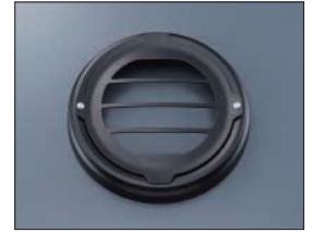
ヘッドライトグリル

Q5K-YSK-112-R06 希望小売価格 ¥25,300 (本体価格 ¥23,000) (D5) 黒色のメーターバイザーを装着することでヘッドライト上部からメーター周りが引き締まり、スポーティーな印象を与えることができます。(取付0.2h)