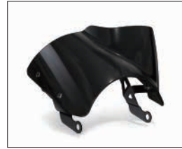
メーターバイザー

Q5K-YSK-112-R06 希望小売価格 ¥25,300 (本体価格 ¥23,000) (D5) 黒色のメーターバイザーを装着することでヘッドライト上部からメーター周りが引き締まり、スポーティーな印象を与えることができます。(取付0.2h)