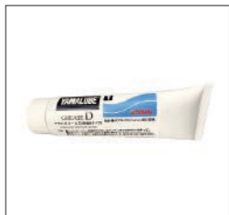
YAMALUBE ヤマハグリースD(耐蝕性タイプ)

90790-74065 50g ¥990(本体価格 ¥900) 90790-74066 200g ¥2,057(本体価格 ¥1,870) 90790-74067 4kg缶 ¥23,100(本体価格 ¥21,000) 水、海水等が浸透する、船外機、水のシール性の必要なモートル駆動シャフト等機械の回転部及びスライド部に最適。高温、耐久性及び防錆性に優れたグリース。