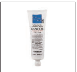
スタンドライブギヤオイル

90790-73614 350ml ¥924(本体価格 ¥840) 90790-73613 800ml ¥1,639(本体価格 ¥1,490) 90790-73612 20L ¥35,310(本体価格 ¥32,100) ヤマハ船外機用。各種ギヤ類の異常磨耗・騒音の抑止に。