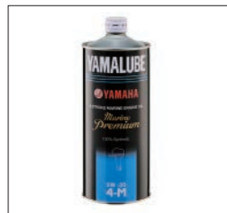
YAMALUBE マリンプレミアム 5W-30

90790-71524 1L ¥3,300(本体価格 ¥3,000) 90790-71523 4L ¥11,880(本体価格 ¥10,800) 90790-71522 20L ¥55,000(本体価格 ¥50,000) ヤマハ4ストローク船外機の性能を引き出し、高いレベルで維持させるために開発された高性能エンジンオイルです。清浄性・耐摩耗性・高温酸化安定性・せん断安定性に優れた粘度変化が少ないため、エンジン保護に貢献します。さらに省燃費性にも優れた性能を発揮します。 100%化学合成油 SAE粘度 5W-30 API規格 SP