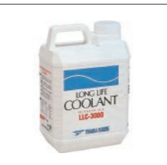
マリンロングライフクーラント LLC-3000(ノンアミンタイプ)

90890-89003 2L ¥3,542(本体価格 ¥3,220) 90790-74034 18L ¥29,414(本体価格 ¥26,740) 凍結防止はもちろん、防錆・防蝕効果にも優れ、冬期は間接冷却用不凍液、夏には、冷却液として使用できます。 ※作業中充分な換気が必要です。ガス等を吸い込まないよう注意してください。