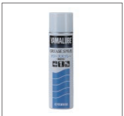
YAMALUBE グリーススプレー(耐水性)

90790-74068 200g ¥2,090(本体価格 ¥1,900) 船外機オイルポンプのオイルシールリップ部などにおすすめ。耐摩耗性・耐荷重性に優れた多目的グリース。