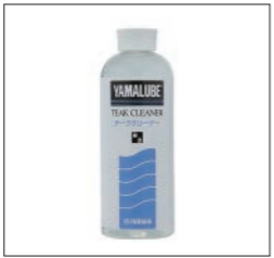
YAMALUBE チーククリーナー

90790-74070 250ml ¥1,980(本体価格 ¥1,800) 強力に海水をはじいて、ガラス面への塩分の付着を防ぎ、航海中の視界を保ち、凍結の防止もします。 ※プラスチックガラス及び超はっ水ガラスには使用しないでください。