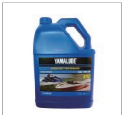
YAMALUBE 4W 10W-40

90790-71514 3.785L(1USガロン) ¥8,316(本体価格 ¥7,560) 90790-71512 4L ¥8,162(本体価格 ¥7,420) ウェーブランナー(マリンジェット)専用。高出力・高回転の使用でも強い粘度特性を発揮。 API規格 SJ ※輸入品のため、納品に時間がかかる場合があります。