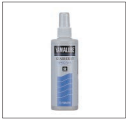
YAMALUBE エンジンガラスクリーナー (YAMALUBE ガラスコート)

90790-74054 300g(固形) ¥4,730(本体価格 ¥4,300) 90790-74055 500ml(液体) ¥2,200(本体価格 ¥2,000) 紫外線や雨、海水に強いFRP用つや出し剤。紫外線吸収剤を特殊配合しているため、海水に浸され、常に日光・風雨にさらされるボートには最高の効果を発揮します。船底、ハル等のツヤだし。各種艦装品、金属部分の防錆、ツヤだしにお使い下さい。(超微粒子コンパウンド入り)