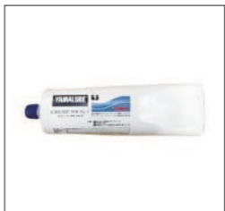
YAMALUBE グリース WR No.2

90890-69920 50g ¥1,045(本体価格 ¥950) 船外機のプロペラジョイント部の潤滑などにおすすめ。耐腐食性が強く、塩水に対して露出金属部分を保護。特殊ポリマーの働きで、強靱な潤滑膜が形成され、水、海水の混入時にも軟化を防ぎます。