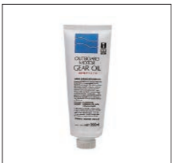
船外機ギヤオイル

90790-73614 350ml ¥924(本体価格 ¥840) 90790-73613 800ml ¥1,639(本体価格 ¥1,490) 90790-73612 20L ¥35,310(本体価格 ¥32,100) ヤマハ船外機用。各種ギヤ類の異常磨耗・騒音の抑止に。