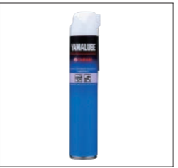
YAMALUBE オイルクリーナー

90790-74058 500ml ¥2,200(本体価格 ¥2,000) チーク材に本来の油分を補給する天然ボイル油を主成分としてあり、チーク材の寿命を延ばし、本来の色ツヤを再生します。また、汚れ等の再付着防止にも優れた効果を発揮します。ヤマハチーククリーナーで洗浄した後、お使い下さい。