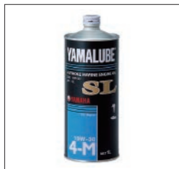
YAMALUBE マリンオイルSL 10W-30

90790-71524 1L ¥3,300(本体価格 ¥3,000) 90790-71523 4L ¥11,880(本体価格 ¥10,800) 90790-71522 20L ¥55,000(本体価格 ¥50,000) ヤマハ4ストローク船外機の性能を引き出し、高いレベルで維持させるために開発された高性能エンジンオイルです。清浄性・耐摩耗性・高温酸化安定性・せん断安定性に優れた粘度変化が少ないため、エンジン保護に貢献します。さらに省燃費性にも優れた性能を発揮します。 100%化学合成油 SAE粘度 5W-30 API規格 SP