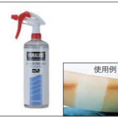
YAMALUBE ボート洗浄剤 BS-1(黄ばみ汚れ専用)

90790-74060 1L ¥3,520(本体価格 ¥3,200) 90790-74061 20L ¥23,430(本体価格 ¥21,300) FRP船舶専用。2~3分間隔で数回スプレーするだけで汚れがおとせます。ハルの黄ばみ汚れにスプレーするだけで、簡単に洗浄できます。強酸タイプとは異なりますので、取扱いが楽です。 ※黒ずみ汚れ、錆汚れは落とせません。