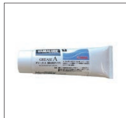
YAMALUBE グリースA(耐水性タイプ)

90790-74065 50g ¥990(本体価格 ¥900) 90790-74066 200g ¥2,057(本体価格 ¥1,870) 90790-74067 4kg缶 ¥23,100(本体価格 ¥21,000) 水、海水等が浸透する、船外機、水のシール性の必要なモートル駆動シャフト等機械の回転部及びスライド部に最適。高温、耐久性及び防錆性に優れたグリース。