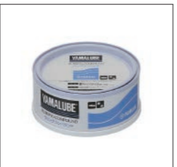
YAMALUBE ラビングコンパウンド

90790-74057 300g ¥2,750(本体価格 ¥2,500) ファイバーグラス、金属部分についてた汚れ、錆等をきれいに落し、新艇時の光沢を取り戻す事ができます。最終仕上げにはヤマハボートワックスの固形タイプ(90790-74054)または、液体タイプ(90790-74055)をお使い下さい。