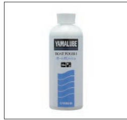
YAMALUBE ポートポリッシュ

90790-74056 500ml ¥1,760(本体価格 ¥1,600) FRP用に開発された画期的なポリッシュです。高品位シリコンワックスに、素材に影響を与えない超微粒子コンパウンドを添加しています。ゲルコートの色劣化、海中生物の付着等による汚れ、ハルに付着した雨垂れ、水あか等をきれいに落とし、その上にワックス効果を発揮します。