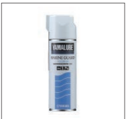
YAMALUBE マリンガード(超防錆浸透潤滑剤)

90790-74062 480ml ¥2,695(本体価格 ¥2,450) 2wayノズルで拡散とスポットノズルで2通りの使い分けができます。優れた水置換性で、さっと吹きするだけで防錆剤が、海水の下にもぐり込み防水皮膜を形成します。また、防湿剤、浸透剤、潤滑剤としても優れた性能を発揮します。