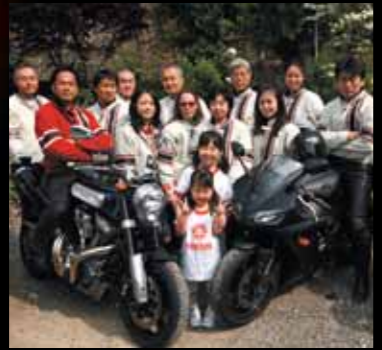
初の「熊野本宮大社」での演奏は、メンバーにとって特別なものだった。

バイクを愛するメンバー達だからこそ、同じバイク乗りの交通安全を心から祈る事ができる。もちろん、その交通安全祈願奉納を行う場所までバイクで向かう。バイクは現代の鉄の馬。それに跨がり、古より伝わる「能」での「奉納」を行うことに「粋」を感じる。