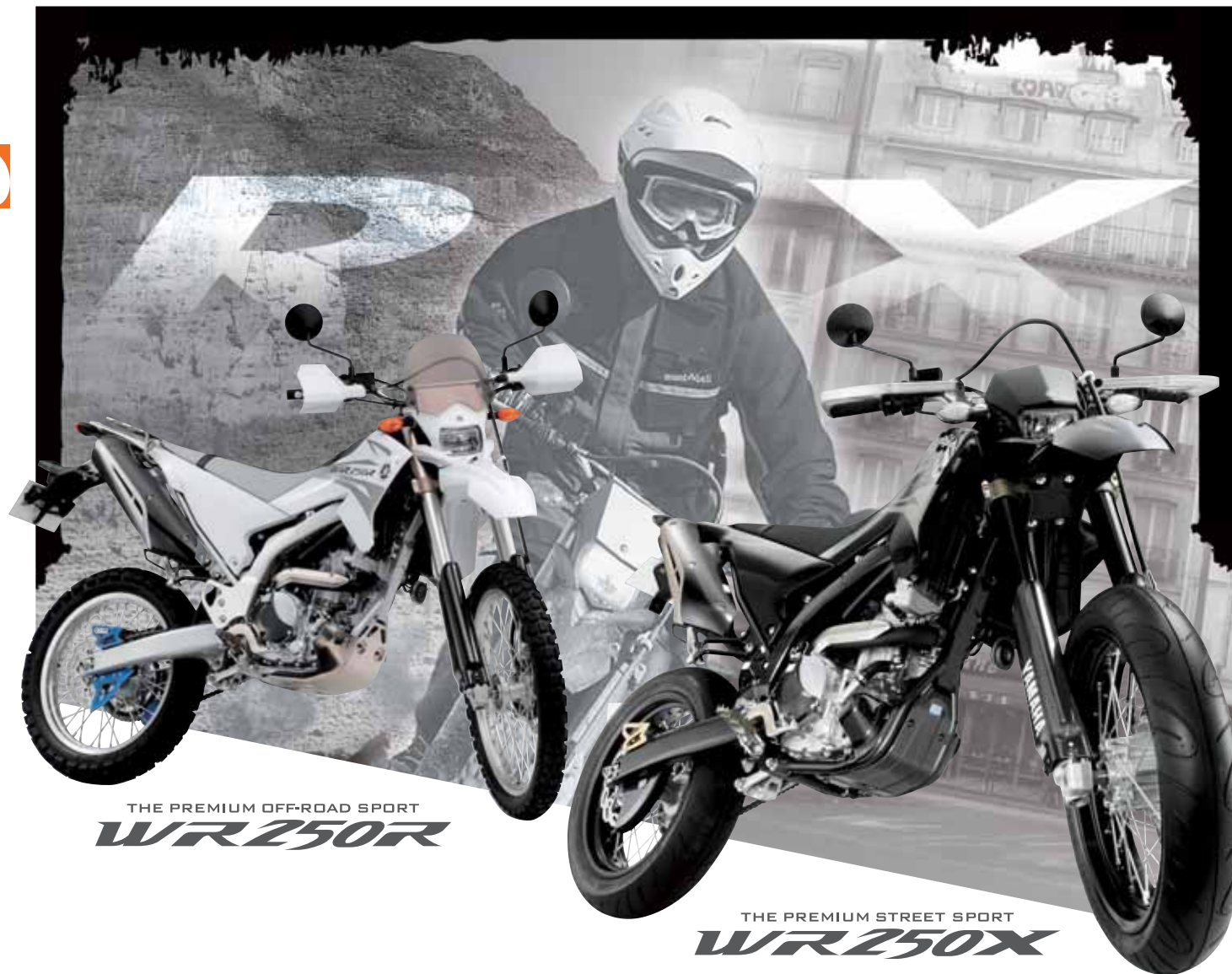
THE PREMIUM OFF-ROAD SPORT WR250R