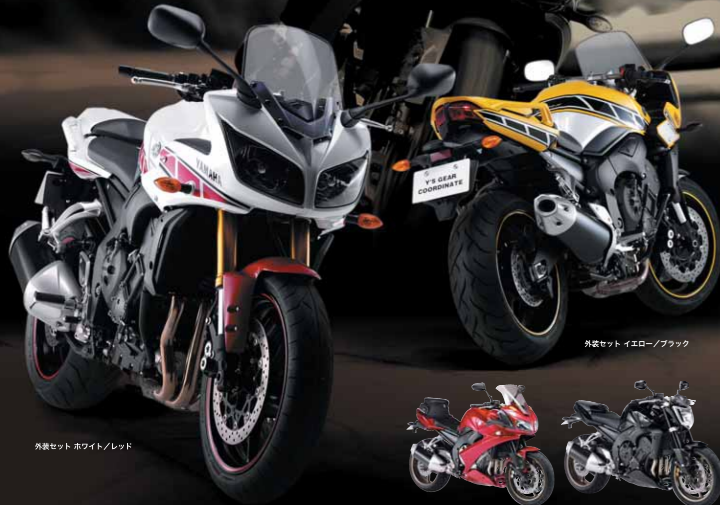
外装セット イエロー/ブラック