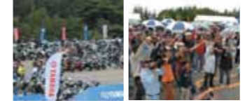
700台以上のドラッグスターと総勢約850人が参加した前回のイベント。今年はさらなる来場者が予想され、大盛り上がりは間違いない!

今年で3回目。毎年大盛況のイベントが初秋に華やかに開催! ドラッグスター誕生10周年を記念して始まった「ドラッグスターミーティング」。今年で3回目の開催となるが舞台は例年と同じく信州八ヶ岳 富士見高原スキー場。 去年は850人を超えるドラッグスターオーナーと、ヤマハファンの方々に大いに賑わった。過去2回までのイベントでは、会場にドラッグスター新シリーズのモデル展示や、ジャパン大会、ラムネ早飲み競争、チャリティーオークション、ライディングワンポイントレッスンなどイベント盛り沢山で来場者を楽しませた。また、無料の「ぎのこ豚汁」や「焼きとうもろこし」などの仕出しもサービスされ、ドラッグスターオーナーの方々が親睦を深める機会となっているのも魅力。 今回も、ファンの方々の期待を裏切らない楽しいイベントになるはず! 信州の初秋をツーリングで楽しみながら、是非「ドラッグスターミーティング」に足を運んでみてはいかが。