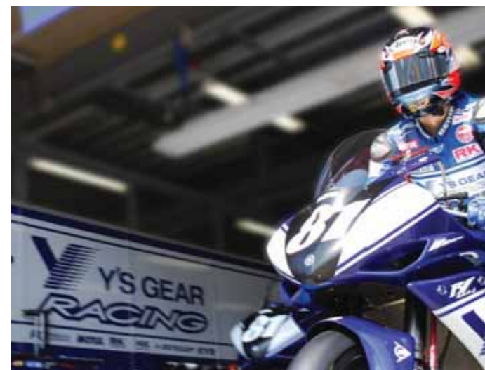
2008年全日本スーパーバイク選手権開幕戦。ワイズギアレーシングは新たな戦いに挑む!

文部科学大臣杯 2008年 MFJ 全日本ロードレース選手権シリーズ第1戦 MOTEGI SUPERBIKE RACE 日時:2008年4月5日(土)・6日(日)