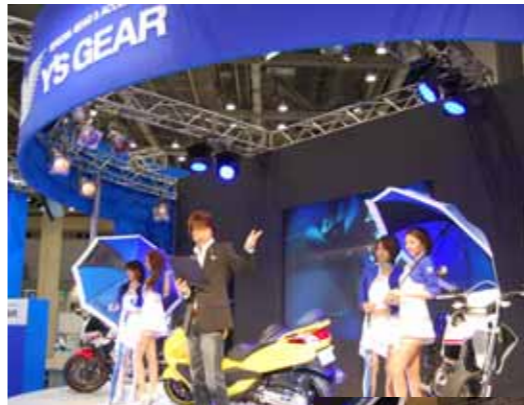
毎回好評だった「ショーステージ」。巨大画面の映像や、MCのトークなど、飽きさせない演出がファンの心を掴んだ。