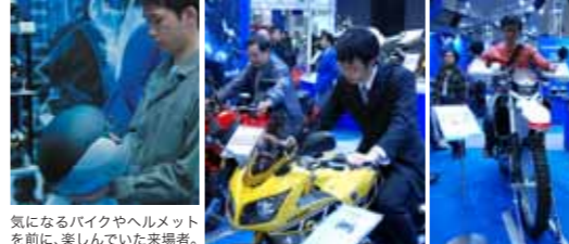
気になるバイクやヘルメットを前に、楽しんで来た来場者。