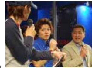
会場を熱気の渦に包んだ「トークショー」。平監督と佐藤選手を一目見ようと、数多くのファンがブース内に集まった。