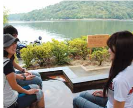
初秋の浜名湖を望みながら、足湯につかり疲れをリフレッシュ。地元の人たちと何気ない会話ははずむ。こんな時間こそツーリングの醍醐味。