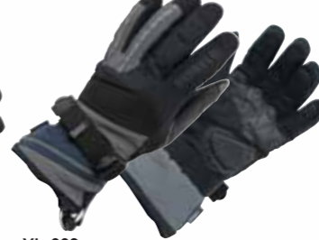
YL-662 ウィンターツーリンググローブ

MATERIAL/■表地:ナイロン 平側:アマーラ ■裏 地:ポリウレタン 平側:フィードセンサー ■ライ ナー:CTXライナー <数量限定生産>在庫なくなり次第、 販売を終了させていただきます。