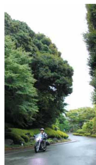
バイクを走らせながら、季節・その土地の匂いを感じて、自分もその一部になれるような気がする。

当日、天気は決して晴れてはいないが、秋のはじまりらしい涼しいクルージング日和になった。エンジンがかかるのとまるでバイクが生きているように躍動、愛車に跨ると、鼓動はさらに強くなりワクワク感がこみ上げてくる。最近仕事も忙しく、ちゃんとバイクに乗る時間がとれていなかったけれど、走り始めるとすぐに感覚が戻ってくる。愛車のDSは、すぐにわたしの体の一部になり、風の中