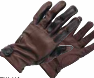
TW-413 ウィンターゴートグローブ

MATERIAL/■表地:牛革 平側:牛革 ■裏地:アクリル ポア 平側:ポリエステル100% ■ライナー:ア クリルポア <数量限定生産>在庫なくなり次第、販売を終 了させていただきます。