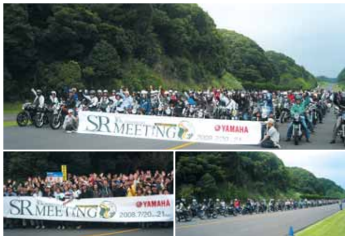
500台以上のSRが一同に並ぶ様子は、まさに圧巻! 長蛇の列が、30周年という長い歴史を物語っているようだった。