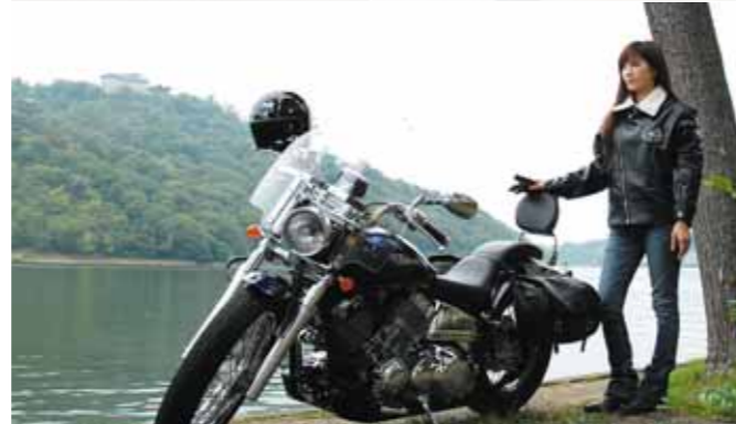
モデル着用ジャケット・Tシャツ / ●RY-2130コンビネーションレザージャケット 希望小売価格 ¥26,250(本体価格 ¥25,000) 2008年10月発売予定【数量限定生産】