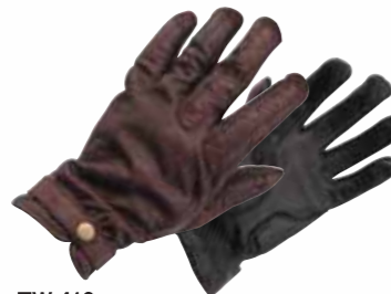
TW-412 ウィンターレザーグローブ

MATERIAL/■表地:レザーノヴァ 平側:レザーノヴァ ■裏地:アクリルポア 平側:ウレタントリコット ■ライ ナー:アクリルポア <数量限定生産>在庫なくなり次第、販売を終了させていただきます。