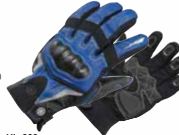
YL-660 スピードブロックグラフィックグローブ

MATERIAL/■表地:ゴート ■裏地:ポリエステル100% ■インナー:(甲側)シンサレート <数量限定生産>在庫な くなり次第、販売を終了させていただきます。