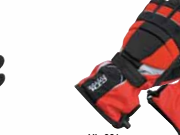
YL-661 CTXツーリンググローブ

MATERIAL/■表地:牛革,ネオプレン 平側:ナツ シュ,牛革 ■裏地:アクリルポア 平側:ポリエス テル100% ■ライナー:アクリルポア <数量限定生産> 在庫なくなり次第、販売を終了させていただきます。