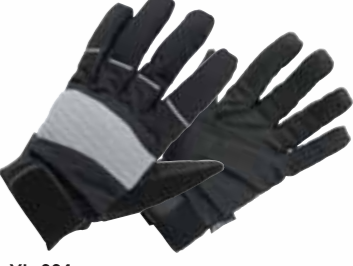
YL-664 ウィンターウォーターブルーフグローブ

MATERIAL/■表地:タスランナイロン,ネオプレン 平側: ナツシュ,ネオプレン ■裏地:アクリルポア 平側:ポリ エステル100% ■ライナー:アクリルポア <数量限定生産> 在庫なくなり次第、販売を終了させていただきます。