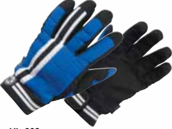
YL-663 ウィンターストリートグローブ

MATERIAL/■表地:タスランナイロン,ネオプレン 平側:ナツシュ,フリースリッパレザー ■裏地:アクリ ルポア 平側:ポリエステル100% ■ライナー:アクリ ルポア <数量限定生産>在庫なくなり次第、販売を終了 させていただきます。