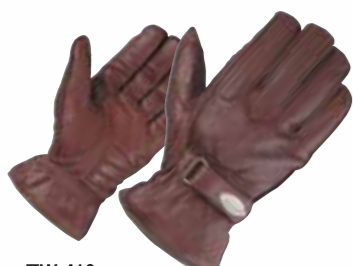
TW-410 レザーヴァウィンターグローブ