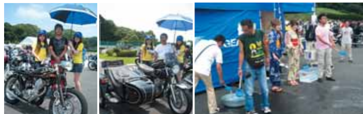
写真左/ワイズギアパーツでカスタムしているSRオーナーとワイズギアガールとの記念撮影サービス。 写真右/地球の温暖化・ヒートアイランド化が進む現在、環境問題を考へての「打ち水大作戦」。真夏の気温を下げながら、ecoを考えた。

30周年記念を迎えたヤマハSR、熱き思いを胸に秘めたオーナー達が集結! 7月20日・21日の2日に渡りSRファンのためのイベント「SR30周年記念ミーティング」が開催され、ヤマハバイクSRを愛する多くのファンが集った。 1978年にSRが誕生してから30年、幅広い世代に多くのファンを持つSRは時代が変わっても人気を呼ぶそのスタイルはいつまでも変わらない。 梅雨明け宣言され本格的に夏入りし、日とも青空の広がる快晴。焼けるような暑い日となった。しかしそれ以上に会場に集まったSRファンはさらに熱気に溢れていた。会場では多くのファンが炎天下の日焼けで真っ赤になりながらも熱くSRについて語り合う姿が多く見られた。 初日、単気筒特有の歯切れの良い音と共に「SR30周年記念ミーティング」は始まった。500台以上のヤマハ「SR」が続々と