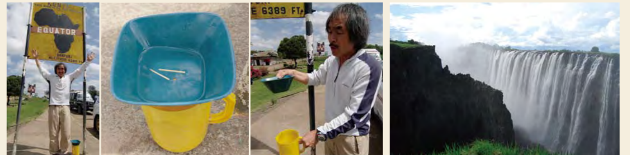
(左から) ナニウキの村の赤道の看板に立って万歳！ 足元にはこんなバケツと漏斗が、、、やってみると、中の水は果たして。(右) 探検家リビンストーン所縁の美しいビクトリアフォール。

秋のツーリングと言えば、そりゃな んたって温泉！なんて柔なことは ここでは言わない。私流に言えば、秋 こそはアグレッシブな「冒険」の季節！ これまで、いつもそう思ってた気合い たっぷりの旅に出かけてきたものだ。 南極、南米、アフリカ、オーストラリ アの大陸をはじめ、NZなどなど。 旅するステージは世界中に一杯だ。日 本のこれから迎える季節が「冬」な らば、南半球は今、温かい「夏」 である。 世の中、自分のいる所だけが全てだ と思つたら大間違い、一日二十四時間、 世界には様々な時間に暮らす人々が いる。起きている人、寝ている人。人生 も暮らしもいろいろだ。泣き、笑い、 怒鳴り、唱う、様々な顔。そして、様々 な自然がある。 「南」で面白かったのは、以前にアフ リカ大陸の縦断中に「赤道」を通過 した時のこと。 「Equator」——所はケニア の「ナニウキ」という村のと真ん中を 貫く国道上だった。走りゆくと前方 に大きな「赤道」を示す文字の入った 黄色い看板が見えてきた。普通、この ような観光スポットには必ずと言って いほど大勢の人々がいて、土産物やら 両替やら様々な面白い文句を武器に観 光客に襲いかかるもののだが、不 思議にもこの時は人っ子一人として見 えなかった（偶然？）。代わりに、看板 の脚にはボツと一つ、黄色のバケツ と緑の漏斗（じょうご）が重ね置かれ ていた。バケツの中には八分目程の水 が入っていて、浮いている漏斗の水面に は長さ5cm程のマチ棒が二本浮かん でいたのだ。と、ここまで言えば、