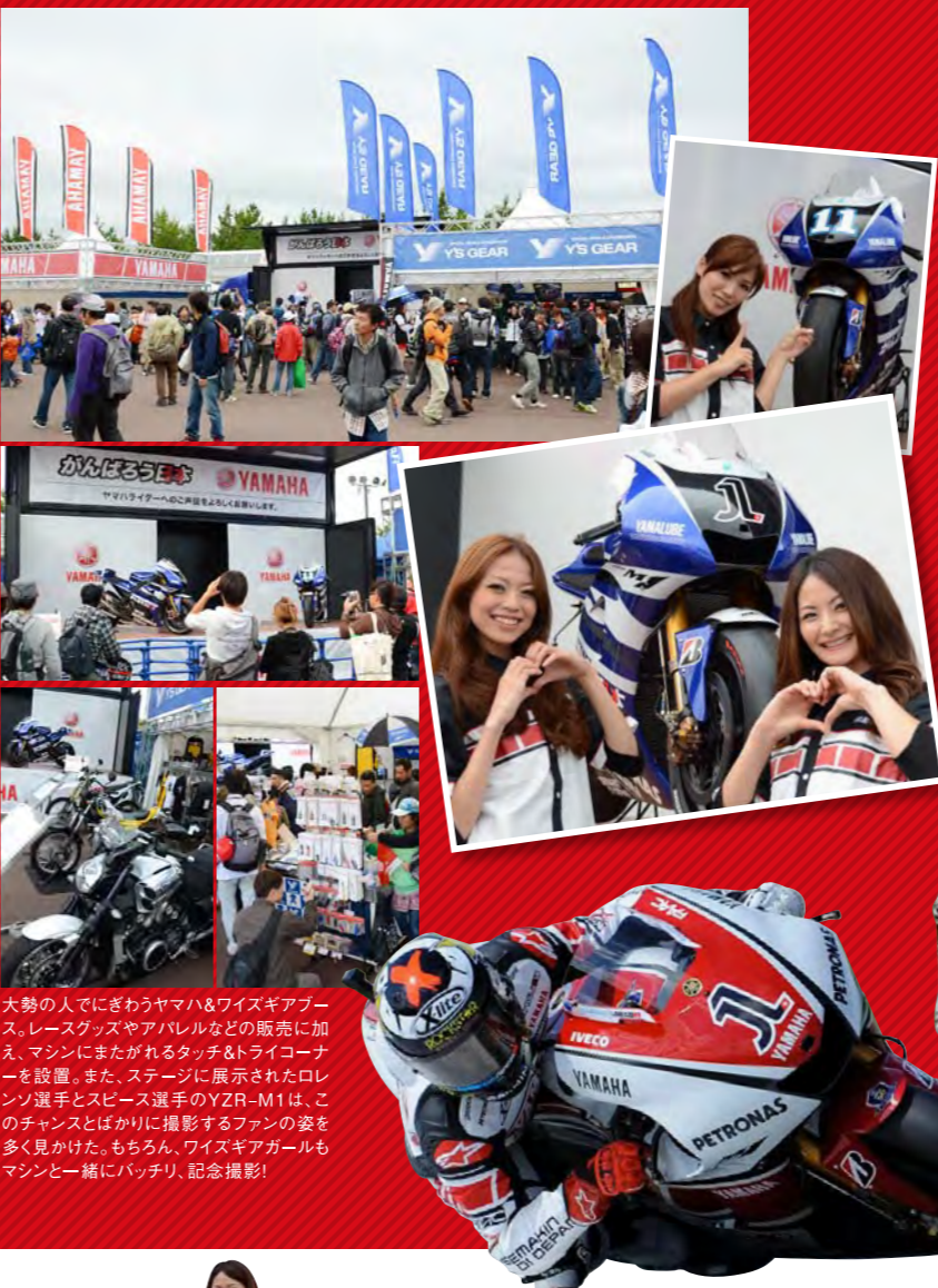
大勢の人でにぎわうヤマハ&ワズギアブース。レースグッズやアパレルなどの販売に加え、マシンにまたがれるタッチ&トライコーナーを設置。また、ステージに展示されたロレンソ選手とス皮ース選手のYZR-M1は、このチャンスとばかりに撮影するファンを多く見かけた。もちろん、ワズギアガールもマシンと一緒にパッチリ、記念撮影！

世界最高峰を誇るバイクレース、MotoGP。先ごろツインリンクもてぎで行われた日本グランプリでは、世界で活躍するライダーの走りを見ようと多くの人が会場へ足を運んだ。熱いレースはもちろん、イベントや展示などあちらこちらで盛り上がりを見せた白熱の3日間を密着レポート！