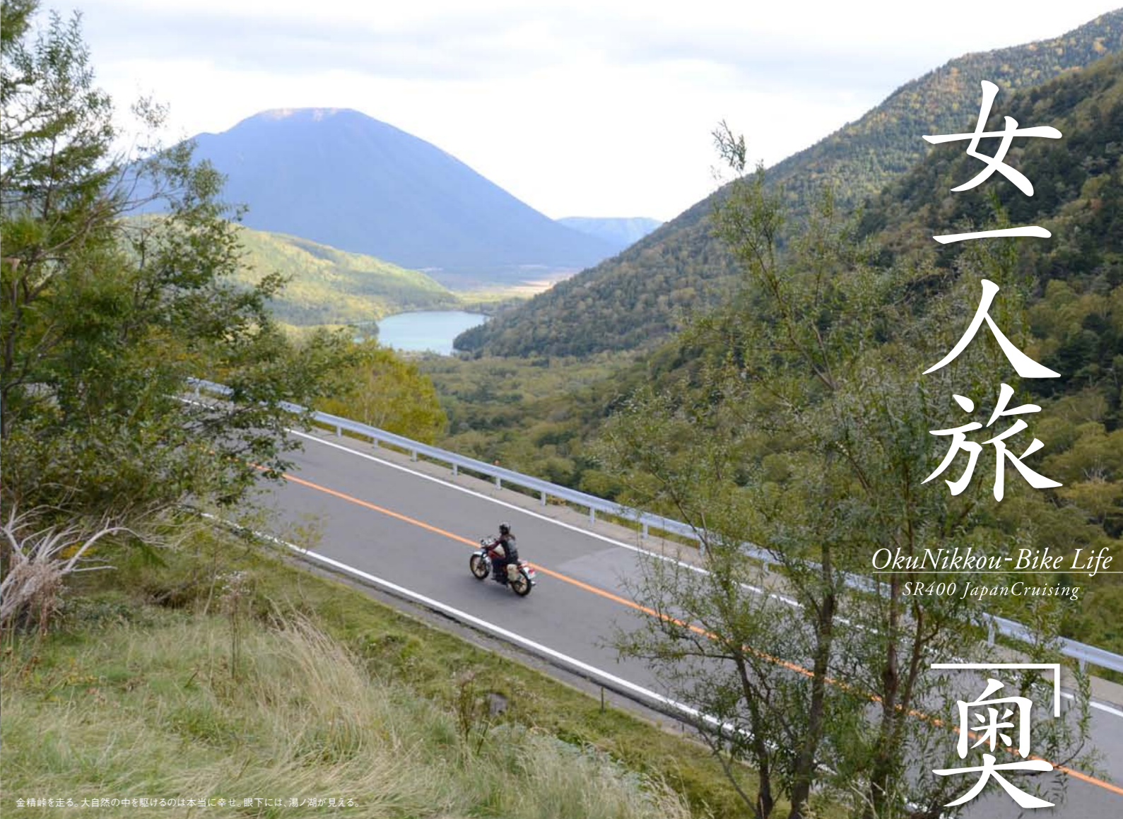
金精峠を走る。大自然の中を駆けるのは本当に幸せ。眼下には、湯ノ湖が見える。