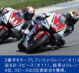
3番手をキープしていたJ・ロレンソ (#1) に迫るB・スピーズ (#11)。結果はロレンソ4位、スピーズは3位表彰台を獲得。