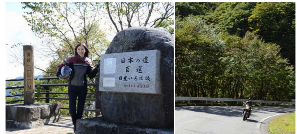
(左) いろは坂中腹の、黒髪平展望台。(右) 日本の道100選のひとつでもある「いろは坂」。勾配のあるタイトコーナーが連続するハードなワインディングロードだ。

秋、ツーリングシーズンの到来だ！今回は「SR400ジャパンクルージング」で栃木県の奥日光へ。美しい自然の中を女一人、爽快に駆け抜ける。 爽やかな風が吹き抜ける秋。ツーリングに最適な季節がやってきた。今回は、週末ライダーの彼女が北関東を代表する観光地、奥日光へツーリングを楽しむ一人旅。奥日光は自然、歴史、温泉など魅力にあふれた街だ。愛車は「SR400ジャパンクルージング」。ヤマハのロングセラーモデルで、味わいのあるフォルムが気に入っているという。また彼女の場合は、ホイールをドレスアップ。ツーリングに便利なタンクバッグやサイドバッグを装着し、もしもの時のレインゲッツも収納してある。さらに走行風を適度に整流するモテレートスクリーンも装着。走りの快適性はもちろん、マシンのファッショニリティも高めているジャパンクルージングパーツの数々がポイントだ。そんな彼女がマシンに乗って、最初に向かったのは「いろは坂」。日光市馬返から中禅寺湖間の国道120号の坂道で上り下りの2つの坂に併せて48のカーブを持つ、日本屈指のワインディングロードだ。紅葉の美しさでも知られるが、この日はまだ早かったよう。彼女も残念がっていたものの、「自然に囲まれながら走るのは最高に気持ちがいい」とこ機嫌だ。