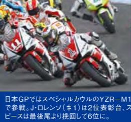
日本GPではスペシャルカールのYZF-RM1で参戦。J・ロレンソ (#1) は2位表彰台、スピーズは最後尾より挽回して6位に。