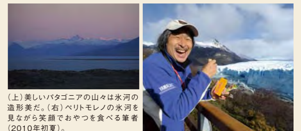
(上) 美しいパタゴニアの山々は氷河の 造形美だ。(右) ペリトモレノの氷河を 見ながら笑顔でおやつを食べる筆者 (2010年初夏)。

*NPO法人「地球元気村」代表 http://www.chikyu-genkimura.com/