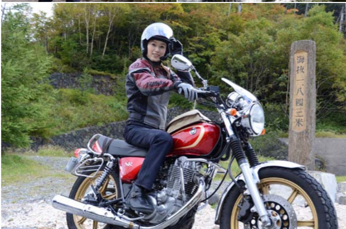
(上) 落差50m、幅25mの湯滝。湯滝を流れ落ちた水は日本有数の高層湿原「戦場ヶ原」を流れる湯川となり、竜頭の滝を下って中禅寺湖へ流入する。(下) 金精峠の標高1843mが今回のゴール。この先のトンネルを抜けると群馬県へ。

秋、ツーリングシーズンの到来だ！今回は「SR400ジャパンクルージング」で栃木県の奥日光へ。美しい自然の中を女一人、爽快に駆け抜ける。 爽やかな風が吹き抜ける秋。ツーリングに最適な季節がやってきた。今回は、週末ライダーの彼女が北関東を代表する観光地、奥日光へツーリングを楽しむ一人旅。奥日光は自然、歴史、温泉など魅力にあふれた街だ。愛車は「SR400ジャパンクルージング」。ヤマハのロングセラーモデルで、味わいのあるフォルムが気に入っているという。また彼女の場合は、ホイールをドレスアップ。ツーリングに便利なタンクバッグやサイドバッグを装着し、もしもの時のレインゲッツも収納してある。さらに走行風を適度に整流するモテレートスクリーンも装着。走りの快適性はもちろん、マシンのファッショニリティも高めているジャパンクルージングパーツの数々がポイントだ。そんな彼女がマシンに乗って、最初に向かったのは「いろは坂」。日光市馬返から中禅寺湖間の国道120号の坂道で上り下りの2つの坂に併せて48のカーブを持つ、日本屈指のワインディングロードだ。紅葉の美しさでも知られるが、この日はまだ早かったよう。彼女も残念がっていたものの、「自然に囲まれながら走るのは最高に気持ちがいい」とこ機嫌だ。