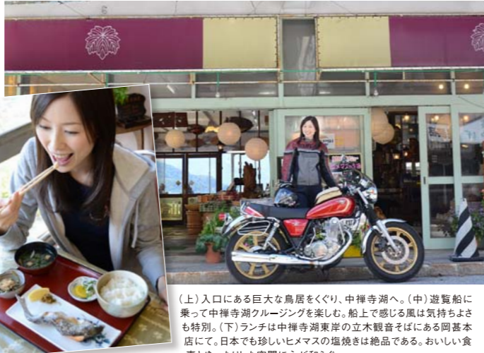
(上) 入口にある巨大な鳥居をくぐり、中禅寺湖へ。(中) 遊覧船に乗って中禅寺湖クルージングを楽しむ。船上で感じる風は気持ちよさも特別。(下) ランチは中禅寺湖東岸の立木観音そばにある岡基本店にて。日本でも珍しいヒメマスの塩焼きは絶品である。おいしい食事とゆったりした空間に心が和らぐ。

「いろは坂」を抜け、彼女が次に向かったのは中禅寺湖。ここではマシンを一旦降り、遊覧船を楽しんだ。また、ランチには日光名物の絶品ヒメマス料理を堪能。こういったその土地の味を楽しめるのも、ツーリングの魅力だと彼女はいう。 そして標高約1390〜1400mの平坦地に広がる400haの湿原「戦場ヶ原」へ。この湿原沿いに続くストレートの道を気持ち良く駆け抜け、次に向かった先は湯ノ湖の南側にある「湯滝」だ。高さ70m、幅25mもあるこの滝は、奥日光三名瀑のひとつに数えられている。滝壺の近くにある観瀑台に立った彼女は、その迫力に感動。また、滝の周囲に多く発生するとされるマイナスイ