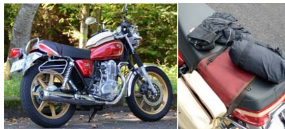
(右) コンパクトに収納できるレインウエア、YAR05ならスタイリッシュなシングルサイドバッグに入れても余裕がある。

オンをたっぷり浴び、気分もリフレッシュしたようだ。さらに散策や名物の「ゆずだんご」も楽しみ、緑に囲まれながらすっきりリラックスモードに。 そして最後の目的地は、「金精峠」（こんせいとうげ）だ。ここは栃木県と群馬県の境にある、標高2024mの日光で一番高い峠。この峠を貫く国道は、長野県小諸市から日光まで続く「日本ロマンチック街道」の一部である。白根山、男体山などの名山や湯ノ湖など、峠付近から眺める雄大な景色を眺めながら「SR400ジャパンクルージング」で気持ちよくこの道を駆け抜ける彼女。奥日光の魅力にたっぷり触れた今回のツーリングは、きつと心に残る一日となっただろう。