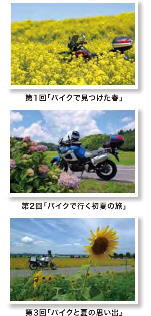
第1回「バイクで見つけた春」