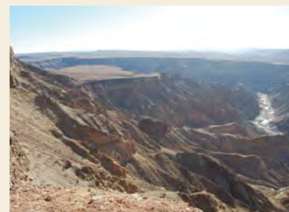
アフリカの溝とも言っているフィッシュ・リバー・キャニオンの圧巻風景。

さらにはナミビアの究極「フィッシュ リバー・キャニオン」の圧巻（深さ 550m、幅27km、長さ160km）。 正に地球に掘られた地上の「溝」で ある。飛んで南アメリカ大陸。究極の 美しさはアルゼンチンの「パタゴニア」 の山々か「ペリトモレノ」の大氷河だ ろう。どちらもかつては地球を覆って いた氷河の残像だ。水の世界には二種 独特の不思議な魅力というものがあ る。およそ人間の感情など介入の余 地もない冷酷さと厳粛、美しさと神 秘。そう、私にとっては生涯忘れら れることのない「南極点」から眺めた北 の景色（極点からは全部が北の方向 となる）には、しみじみと旅の究極を 見る思いがした。 「感動」——それは冒険の果てに得 られる宝物。つくづくバイクは多く の感動を我々にもたらしてくれる乗り 物だと思えばかりだ。