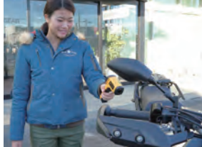
赤外線放射温度計を使い、グリップヒーターの温度を測定。