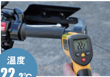
グリップウォーマーOFFの状態では 外気温とほぼ同じ22.2°C