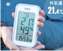
外気温21.4°Cの条件下で測定。