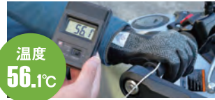
グローブを装着してハンドルを握った状態でのグリップ表面温度は56.1度に達した。

MT-09TRAのグリップウォーマーは、車両に装備されたスイッチで操作でき、メーター内でステータスが確認できる。低、中、高の3段階に切替でき、それぞれの温度設定を10段階の中からあらかじめプリセットしておく。